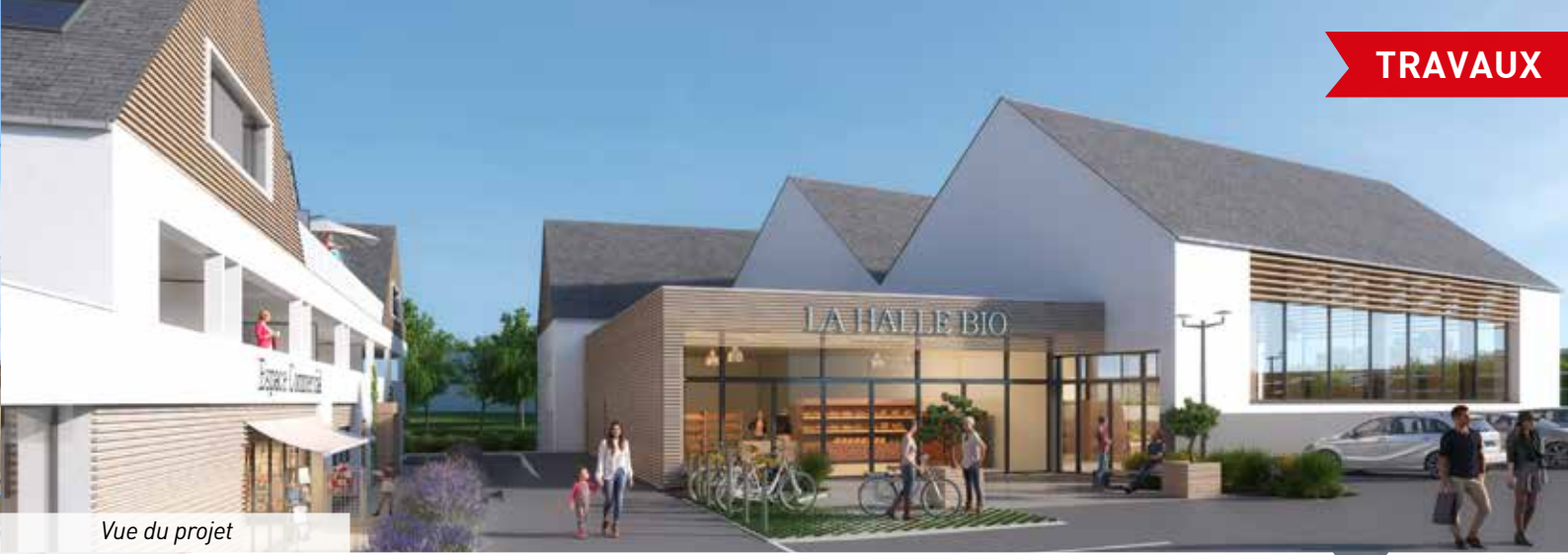
Vue du projet