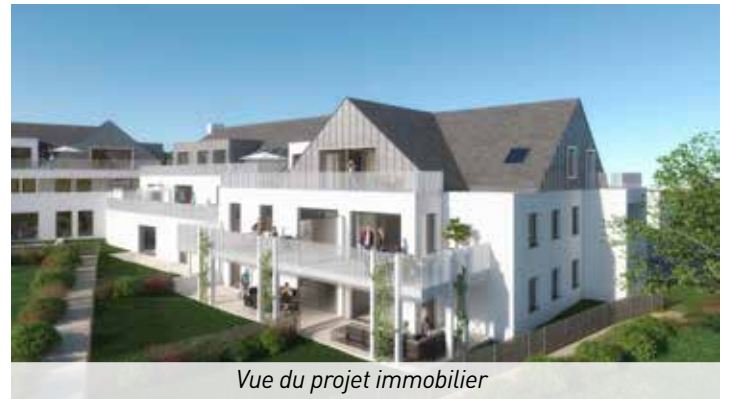
Vue du projet immobilier