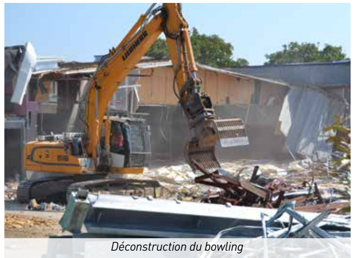
Déconstruction du bowling