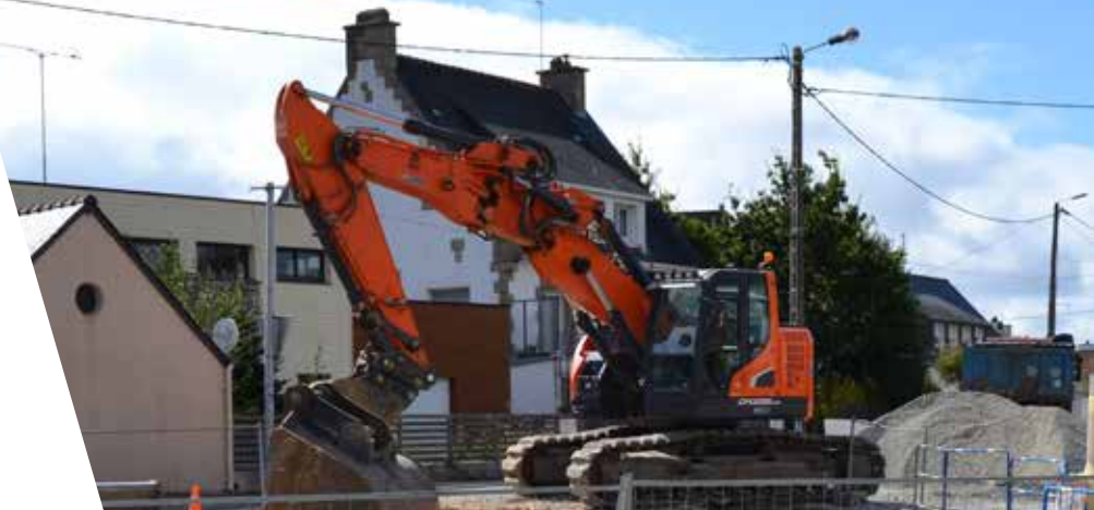
Travaux sur les réseaux d'eaux au niveau de l'intersection avec la rue de Kernével

Le coup d'envoi des grands travaux sur l'avenue Jules Le Guen a été donné fin août. La première phase de travaux, réalisée sous maîtrise d'ouvrage de Lorient Agglomération, concerne le remplacement des réseaux d'eaux usées et d'eaux pluviales. Elle prendra fin en décembre 2018. Le réseau gaz sera également remis à niveau par GRDF. Les travaux d'effacement des réseaux prendront ensuite le relais en janvier 2019.