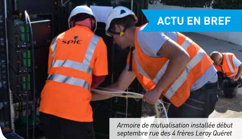
Armoire de mutualisation installée début septembre rue des 4 frères Leroy Quéret

Chaque été, les communes - notamment littorales - connaissent le même phénomène : les terrains accessibles sont régulièrement «squattés» par les gens du voyage. Et si les élus prennent toutes les dispositions nécessaires pour obtenir une ordonnance d'expulsion dans les 24 ou 48 h auprès d'un juge, il est difficile de faire bouger les caravanes sans l'aide des forces de l'ordre. Souvent, c'est par le dialogue que la municipalité réussit à faire partir la petite communauté installée illégalement.